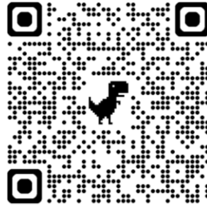
Registro al encuentro